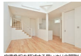
家事負担を軽減する思いやりの間取り