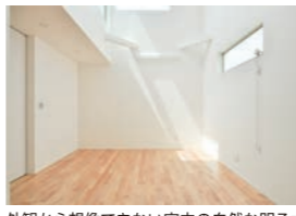
外観から想像できない室内の自然な明るさ