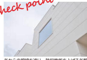
外からの視線を遮り、防犯性を上げる外観